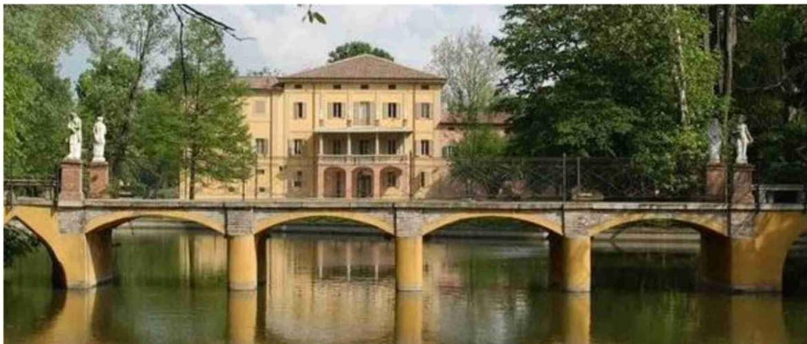
Villa Smeraldi è una residenza rurale che ospita nelle sue sale il museo della civiltà contadina

«Quanto fatto finora ci aiuterà a progettare e potenziare le attività per il futuro»