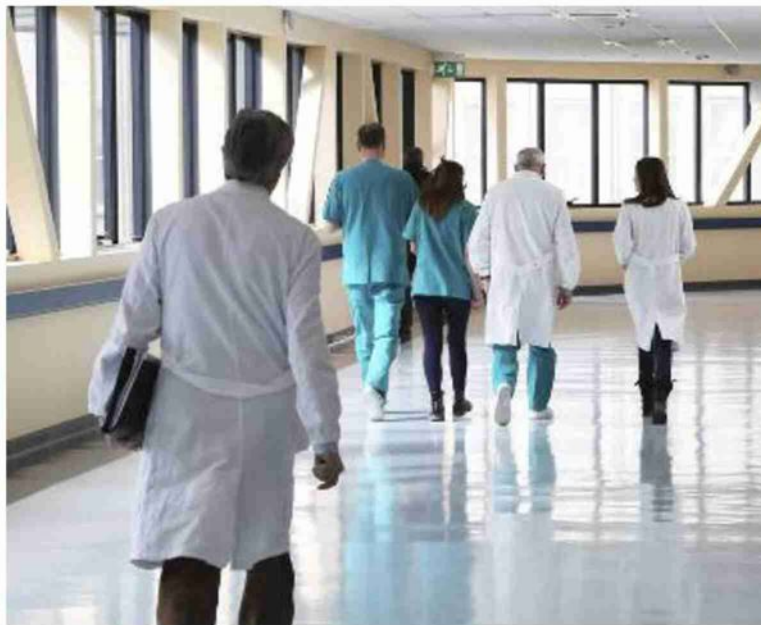
Consulenze chirurgiche nei reparti di Medicina, Lungodegenza e Pronto soccorso