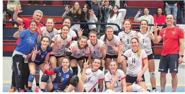
Che esultanze In alto il Nonantola festeggia il successo interno, a sinistra i festeggiamenti di Moma e Stadium. Nella foto grande il Corlo celebra il successo sul terreno della corazzata Ozzano (Serie C femminile, girone B). A destra il Sassuolo vittorioso su Cento e Modena Volley per il derby conquistato con sorpasso su Modena Est. Sotto in senso orario i festeggiamenti di Casinalbo, Spezzanese Anderlini, San Faustino e Volley Modena. In basso il Limidi (Serie D femminile, girone C) si conferma al secondo posto sbancando il parquet di Bologna.