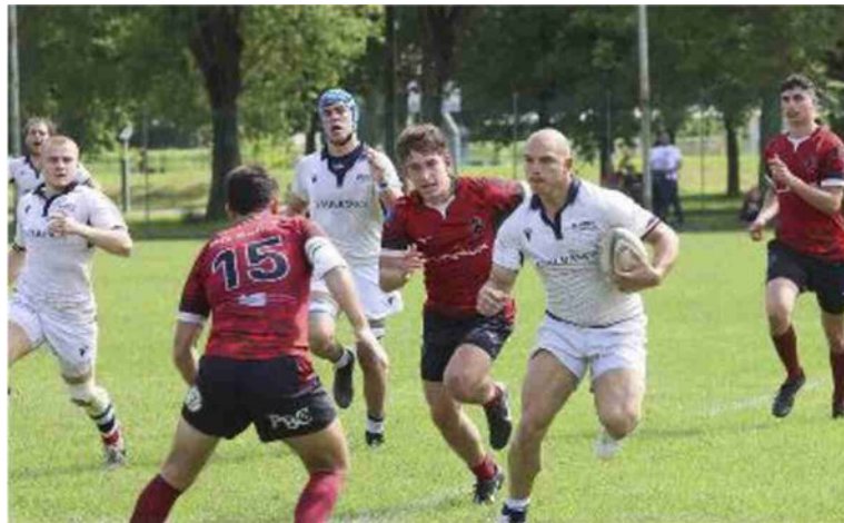
Soavi in azione: oggi l'Emil Banca gioca la sua ultima partita casalinga, la penultima di questo campionato. I ragazzi di Brolis vogliono chiudere in bellezza

Classifica: Modena 63, Brixia 55, Bologna e Bergamo 47, Lyons 42, Colorno 40, Rovato 38, Sondrio 34, Botticino 27, Pieve 25.