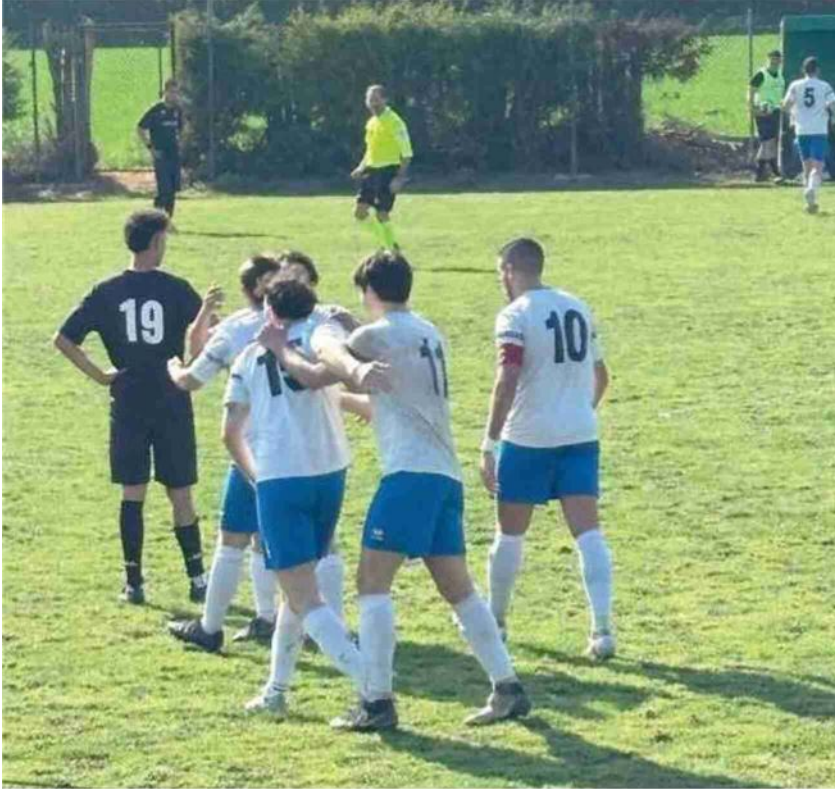
Terza A Esultanza del Magreta nell'anticipo di ieri contro l' Athletic Solignano