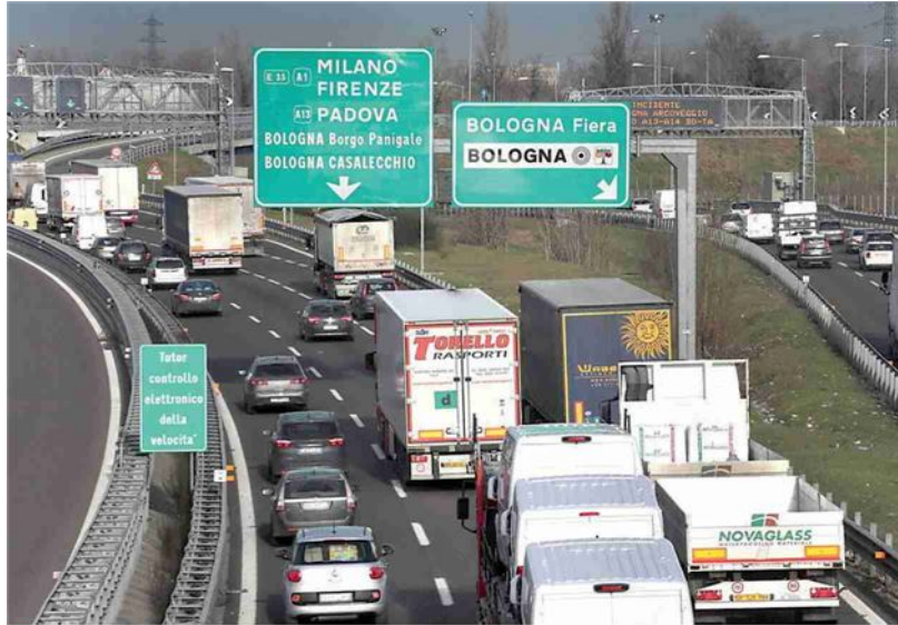
Il nodo autostradale di Bologna. Il governo dice no al Passante