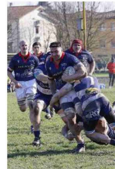
Il derby tra Pieve ed Emil Banca