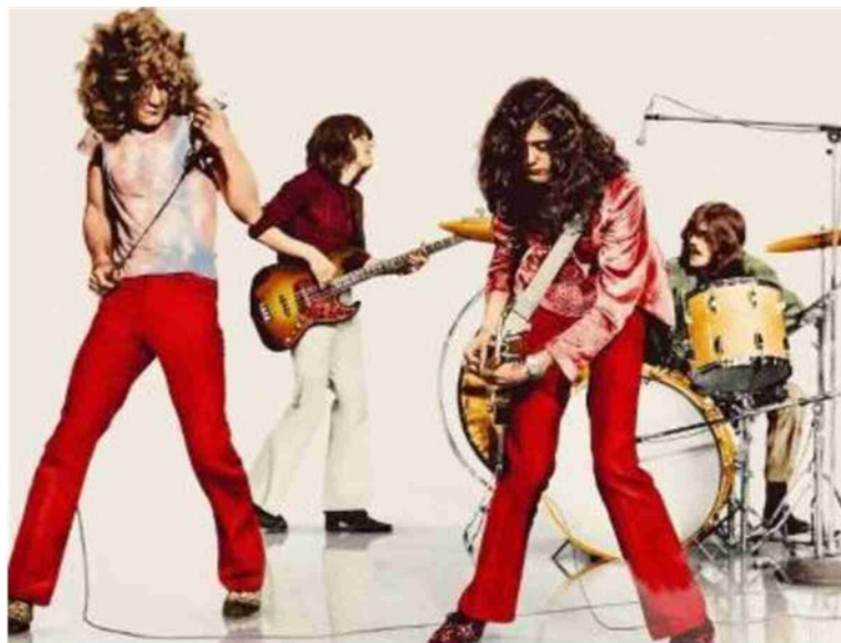
'Becoming Led Zeppelin' sarà proiettato dal 25 maggio al cinema Galliera