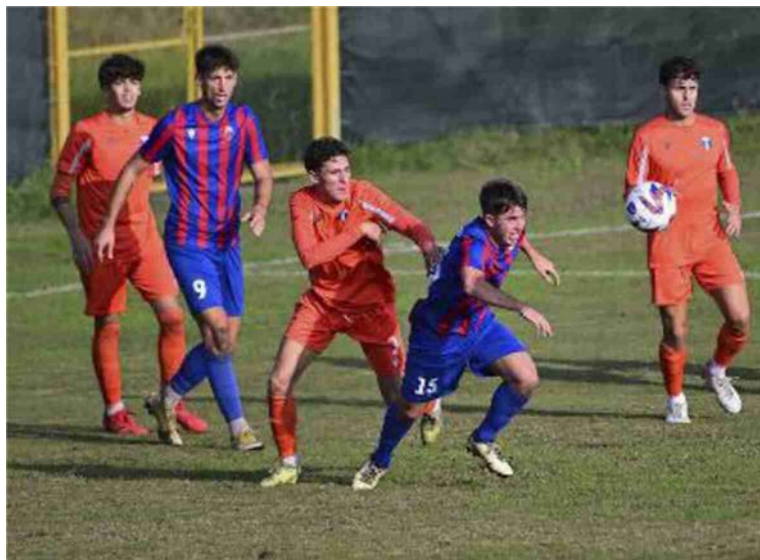
Il derby dell'andata: il Corticella aveva battuto 2-0 il Progresso (Schicchi)