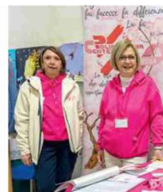
Polisportiva Centese rosa