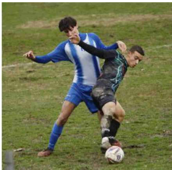
L'ultima uscita del Corticella contro la capolista Forlì (Schicchi)