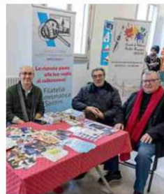
Circolo culturale "Mario Grandi"