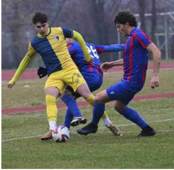
Una fase del derby tra Sasso Marconi e Progresso (Schicchi)