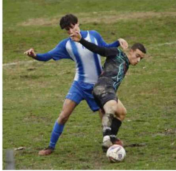
L'ultima uscita del Corticella contro la capolista Forlì (Schicchi)