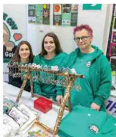
Il sogno di Gaia