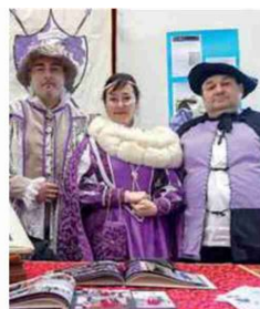
Governatore antiche terre Gambero