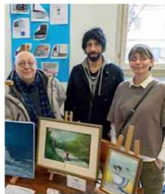
Circolo di pittura "Bonzagni"