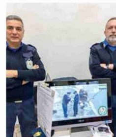
Agriambiente vigilanza pesca

Un altro grazie, grandissimo, a Pro Loco Renazzo, Astrofile, Tarari Tararera, Gipsoteca Vitali, Uisp e al vicesindaco Salatiello