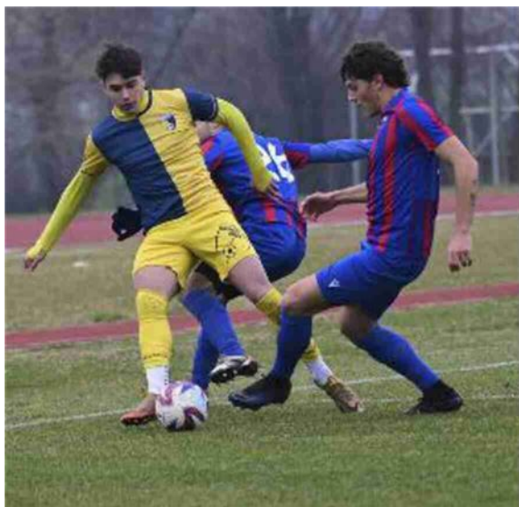
Una fase del derby tra Sasso Marconi e Progresso (Schicchi)