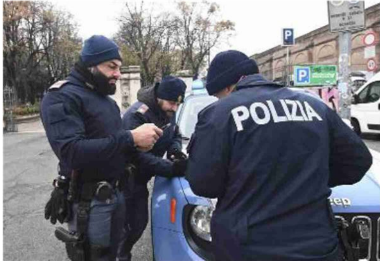
La polizia in piazza XX Settembre durante i controlli