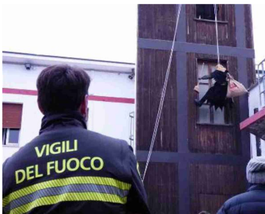
Sopra, la Befana acrobatica dei vigili del fuoco. Sotto, il gruppo di pompieri