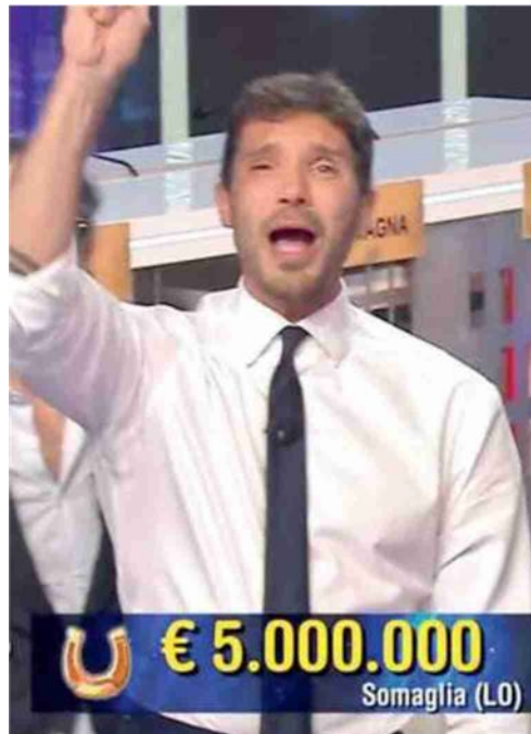
L'annuncio di De Martino del biglietto vincente da 5 milioni