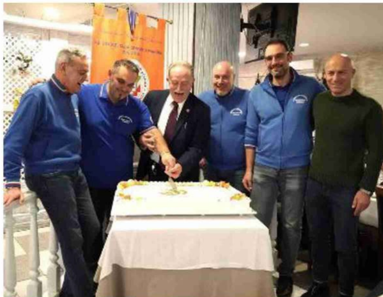
Il taglio della torta per il 35° anniversario della Croce Italia Comuni di Pianura

«Il gruppo fondatore non poteva pensare a questo traguardo straordinario»