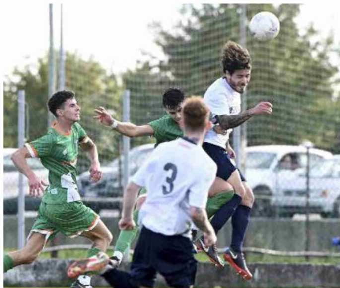
Consandolo e Masi Torello, entrambi fuori casa questa sera