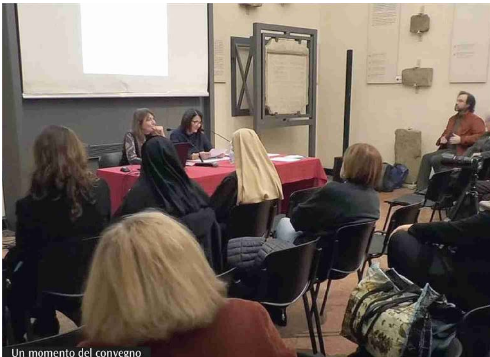
Un momento del convegno