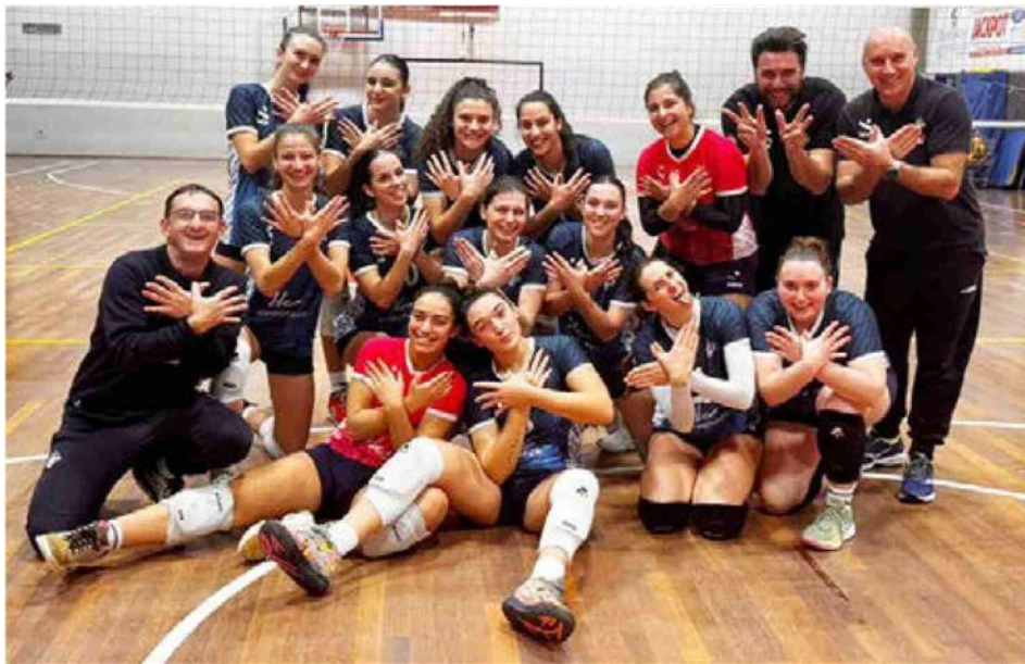
La Mondial Holacheck dopo la vittoria sul campo dell'Everton Reggio