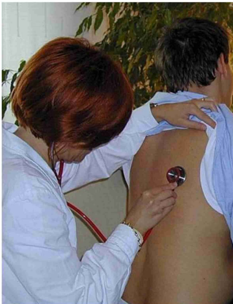
Le Case di Comunità mirano a potenziare l'assistenza sanitaria territoriale

« In un secondo tempo creeremo un nuovo polo socio- sanitario in quello che adesso è il centro per disabili»