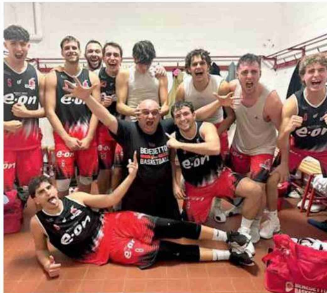
La foto dopo la vittoria a Bologna: è ormai prassi per la Benedetto 1964