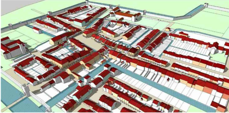
Una porzione del Borgo San Francesco con al centro la piazza del mercato, futura piazza Garibaldi e, a nord della canalina, l'inizio del Borgo Forte