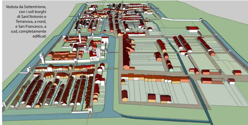
Veduta da Settentrione, con i soli borghi di Sant'Antonio e Terranova, a nord, e San Francesco, a sud, completamente edificati

In alto, la cittadella con la torre duecentesca, la Sagra e palazzo di Castelvecchio a dominare la piazza interna. Qui sopra, l'attuale piazza Garibaldi, cuore del borgo di San Francesco