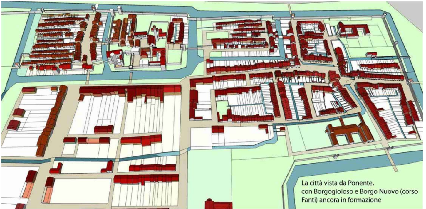
La città vista da Ponente, con Borgogioioso e Borgo Nuovo (corso Fanti) ancora in formazione