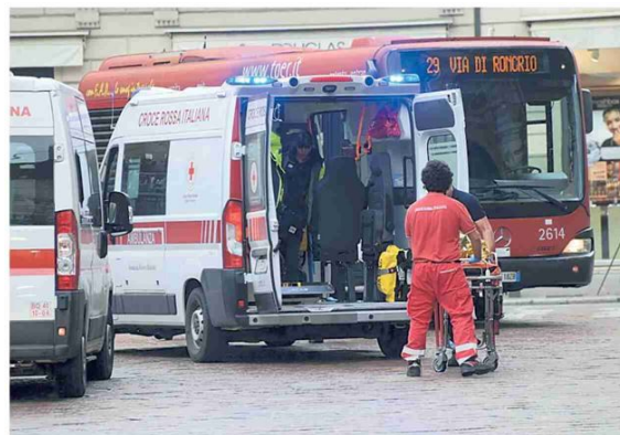
▲ I soccorsi L'ambulanza di fianco al bus, è la mattina del 15 maggio 2023

Il fratello dell'autista che la investì in via Rizzoli: "È scritto anche nel verbale dei vigili". Ma sui mezzi non è obbligatorio