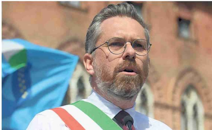
▲ Il sindaco Matteo Lepore