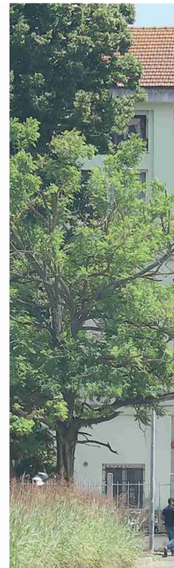
L'ex hotel Nord Ovest di viale Po sarà messo all'asta il 19 luglio, e l'ex Hub di Ponte il 28 giugno