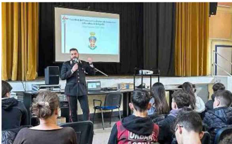
L'incontro sul tema della violenza sulle donne che si è tenuto nel teatro comunale di Argelato