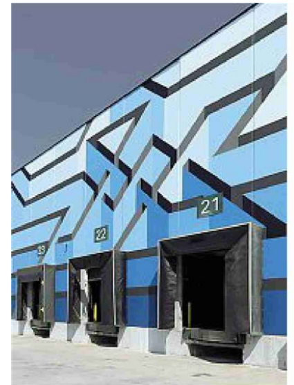
Visioni Dall'alto Moneyless, «Bologna 01»; Etnik, «Carosel»; Joys, «Panorama vibrante»