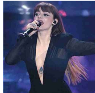
▲ Arena Unipol Annalisa