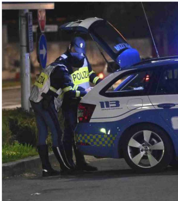
L'uomo è incappato in un controllo della polizia stradale in tangenziale

Dopo la direttissima, l'uomo, che risponde di spaccio, è stato messo ai domiciliari dal giudice, in attesa della sentenza