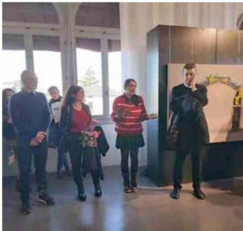
Un momento dell'inaugurazione di “Miraggio”, la mostra aperta nei giorni scorsi e visitabile fino a maggio alla pinacoteca di Pieve di Cento