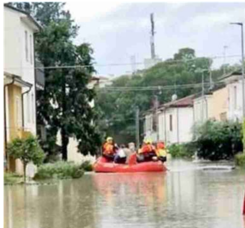
Immagine dell'alluvione dello scorso maggio

Il ministro risponde ai dubbi sollevati da alcuni parlamentari