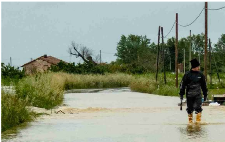
L'alluvione nelle zone di Imola

bensì riguarda «tutte le aree provinciali per le quali è intervenuta la deliberazione dello stato di emergenza nazionale». E sia il contributo di autonoma sistemazione sia le prime misure economiche di immediato sostegno nei confronti della popolazione e quelle per far ripartire le imprese danneggiate si applicano «in relazione allo stato di emergenza nazionale». Insomma, senza distinguo tra Comuni inseriti o meno in un elenco.