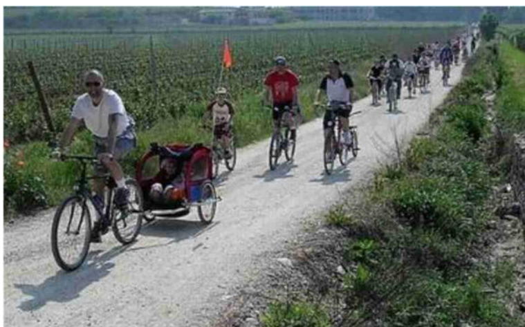
Una grande ciclovia che attraversa le campagne della provincia e collega i paesi

canza di infrastrutture, ma potrà essere veicolo per il turismo lento, portando benefici a tutti i territori dell'Alto ferrarese. Il progetto è contraddistinto da tappe immaginate proprio per i turisti che potranno fermarsi sul nostro bellissimo Comune, scoprendone le eccellenze. E' stata ripagata la scelta di destinare l'avanzo di amministrazione su questo progetto piuttosto che sul polo scolastico, i cui costi aggiuntivi grazie a questa nostra lungimirante scelta sono stati finanziati dalla Regione».