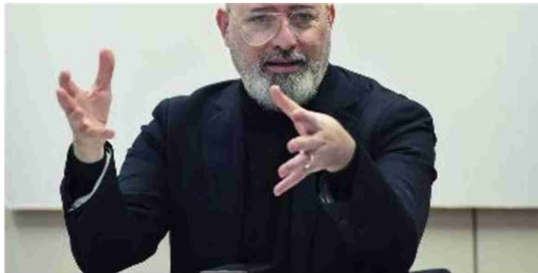
Il governatore dell'Emilia-Romagna Stefano Bonaccini