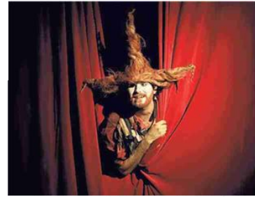
Debutto All'Arena del Sole