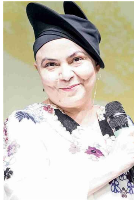
Penne magiche Silvia Avallone, Michela Murgia e Gianrico Carofiglio.