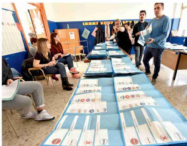
▲ Verso il voto Alle regionali urne aperte il 17 e 18 novembre