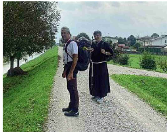
Prima tappa La prima tappa del cammino di Sant'Antonio con fra' Cavalli