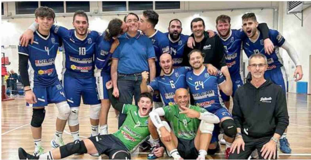
Tra attese ed emozioni Sopra la festa del 3M Cavezzo per il successo interno al tiebreak con il Crevavolley.net A sinistra, Bsc Materials Sassuolo, Moma Anderini Modena e uno scambio del Volley Modena (B1 femminile) In basso i festeggiamenti di Bper Banca Modena Volley, Holacheck Mondial Quartirollo, Polisportiva Modena Est A destra, l'As Carlo celebra la vittoria al quinto set con la Persicetana e la festa di casa Maritain con la Libertas In basso, il Sassuolo esulta tra le mura amiche con il Quistello e il Soliera 150 sconfitto a San Giorgio di Piano