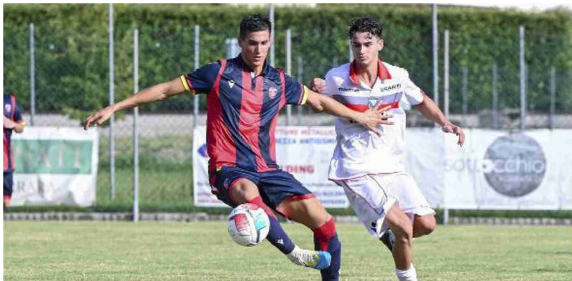
Duello molto atteso a Masi: i padroni di casa ricevono la Comacchiese e sono ancora al palo

A Porotto arriva il Trebbo, Casumaro in viaggio verso Borgo Tossignano. Si gioca alle 15.30