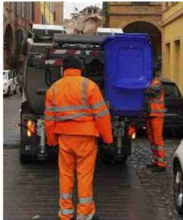
PIEVE DI CENTO

ni potranno utilizzare il centro di raccolta di Castello d'Argile in via Maria Govoni, ex Circonvallazione Ovest la cui apertura sarà potenziata arrivando a coprire tutti i giorni della settimana: lunedì dalle 8 alle 12; martedì dalle 7 alle 13; mercoledì dalle 8 alle 12; giovedì dalle 14,30 alle 17,30; venerdì dalle 8 alle 12 e sabato dalle 8 alle 13 e dalle 14 alle 17. A Pieve per il ritiro di sacchi e bidoncini, rimane a disposizione l'ecosportello in municipio (accesso da Via Gramsci, il martedì dalle 8 alle 10.