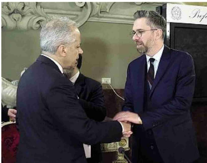
Insieme Il ministro Matteo Piantedosi con il sindaco Matteo Lepore