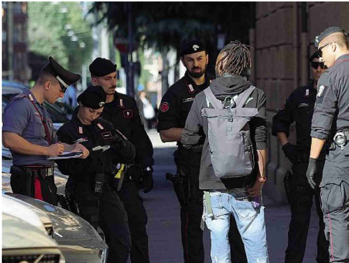
In azione L'operazione di controllo del territorio tra piazza XX Settembre, Galleria 2 Agosto e via Boldrini