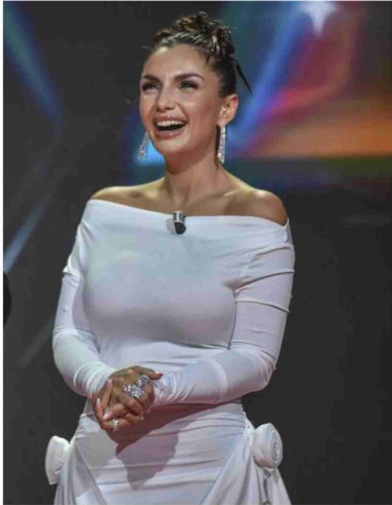
Elettra Lamborghini, figlia di Tonino e nipote del fondatore della Casa del Toro