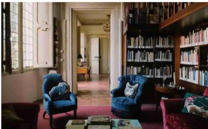
Uno degli ambienti della biblioteca ricreati a Palazzo Bentivoglio. A lato, Busmanti

I volumi, catalogati, saranno consultabili ogni martedì dal 15 ottobre