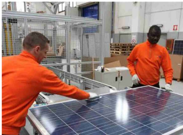
Dopo la fase della consultazione il Comune ha avviato il percorso del Cer

«In questo modo si può accedere ai contributi per l'utilizzo delle fonti rinnovabili»