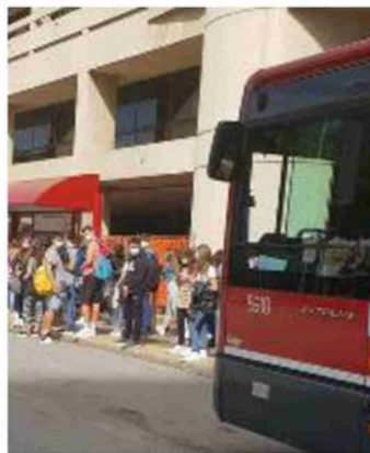
Studenti aspettano il bus in Fiera