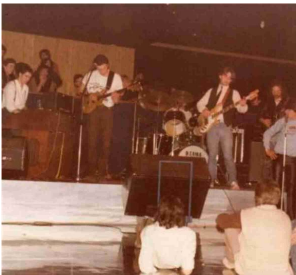
Un concerto storico degli Havock, domani alla Sagra di Santa Croce