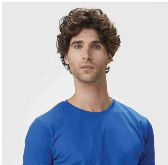
IL CATALOGO DEI CAPI DISPONIBILI È SCARICABILE ON LINE