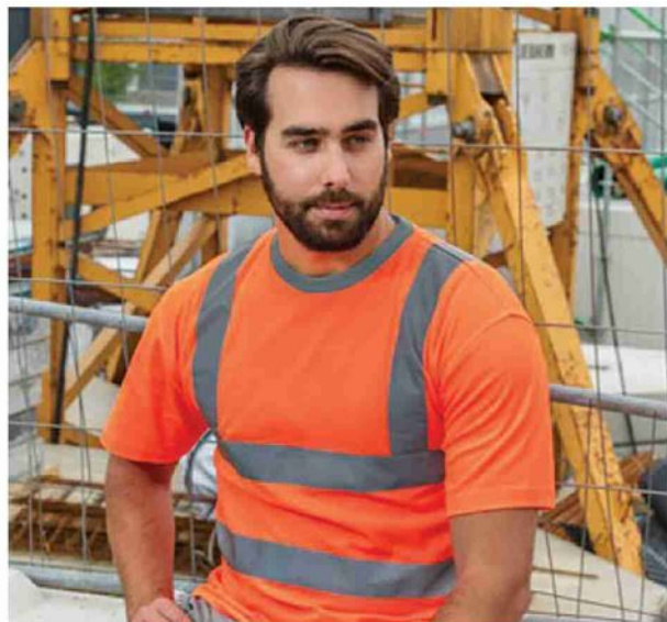
L'AZIENDA HA APERTO LE SUE PORTE NEL NOVEMBRE 1973