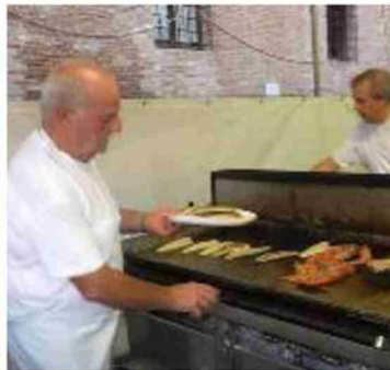
Una delle passate edizioni della Festa del Pesce di Gualtieri