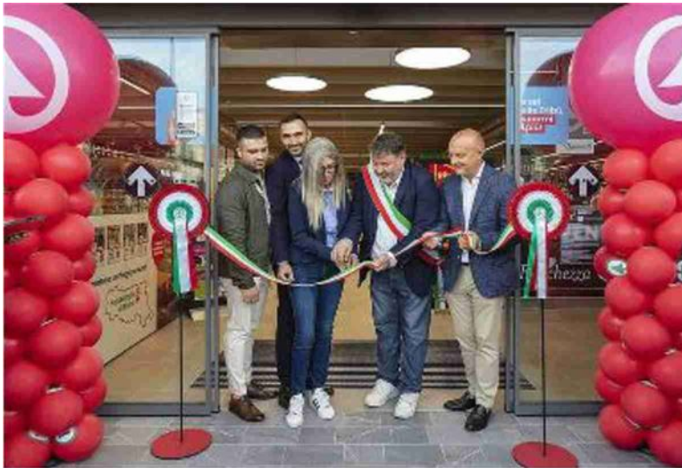
Sopra, il taglio del nastro e, sotto, la squadra del nuovo Eurospar