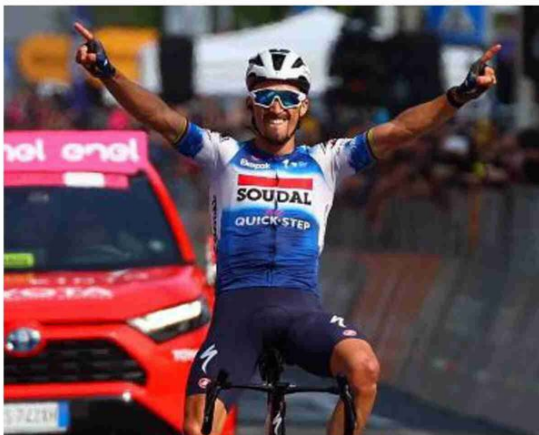
Julian Alaphilippe è arrivato da solo a Fano dopo una lunga fuga

Classifica: 1) Tadej Pogacar (Slo, Uae), in 45h 22'35", 2) Martinez (Col) a 2'40", 3) Thomas (Gbr) a 2'56", 4) O' Connor (Nzl) a 3'39", 5) Tiberi a 4'27".