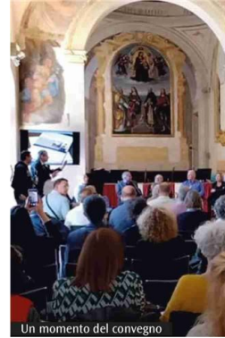
Un momento del convegno

co Emilia, Area culto e alle 18 per l'Hospice di San Biagio di Casalecchio, nella chiesa di di San Biagio.