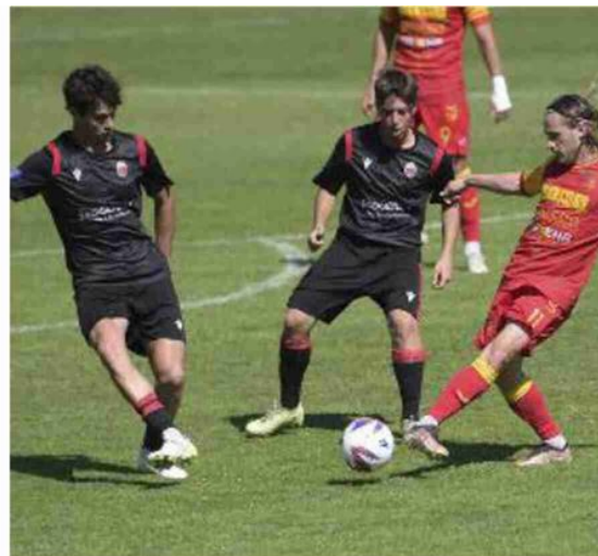
Il Progresso impegnato contro la corazzata Ravenna (Schicchi)