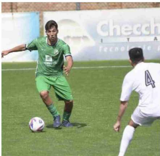
Il Mezzolara nel match contro la Sammaurese (Schicchi)