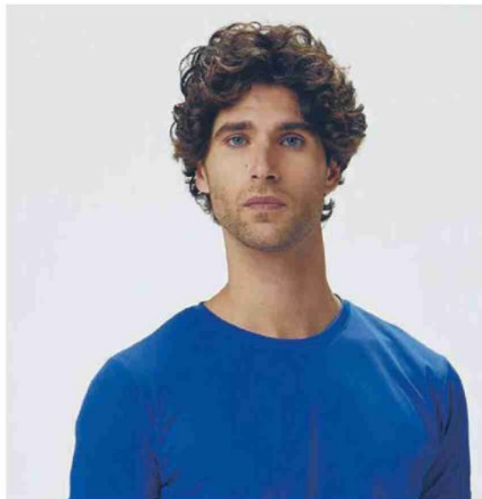
IL CATALOGO DEI CAPI DISPONIBILI È SCARICABILE ON LINE