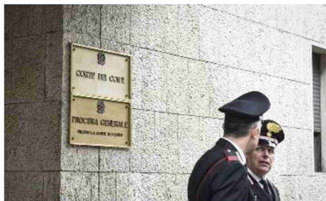
Il piano di rientro dal disavanzo è passato al vaglio della Corte dei Conti

Controlli successivi hanno alzato la cifra da 3,6 a 4,2 milioni per debiti ulteriori