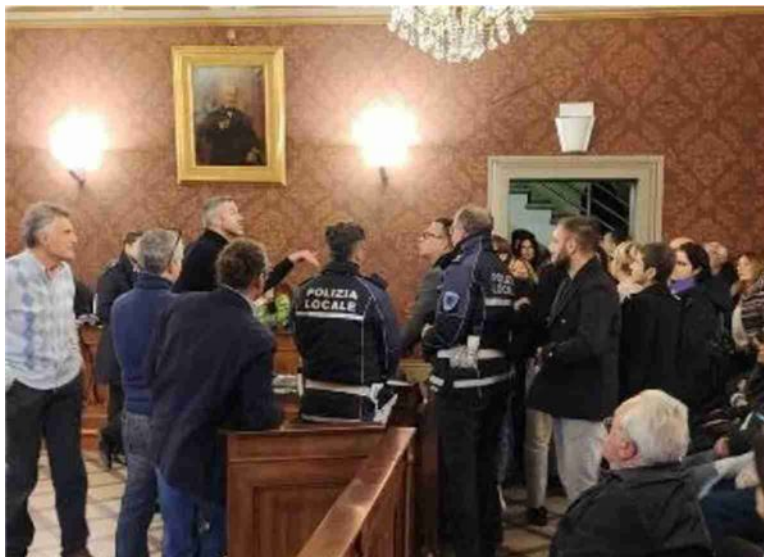
Un momento di tensione in consiglio comunale nei mesi scorsi durante l'aspro confronto tra maggioranza e opposizione sul disavanzo