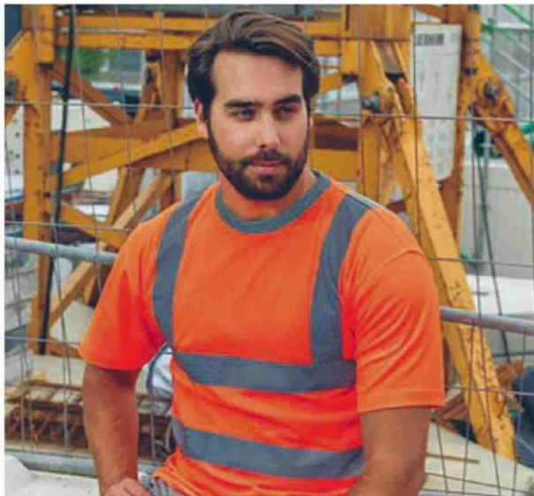
L'AZIENDA HA APERTO LE SUE PORTE NEL NOVEMBRE 1973