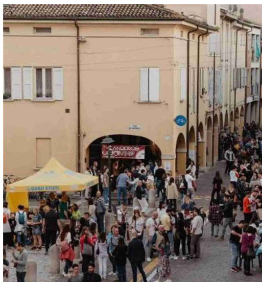
Folla in centro a San Giorgio in una delle precedenti edizioni della manifestazione enologica

Il sindaco Crescimbeni: «Questo evento valorizza le nostre potenzialità»