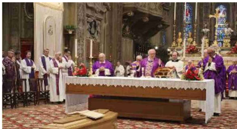
I funerali a monsignor Antonio Bentivoglio sono stati celebrati ieri mattina

eterna che è arrivata al termine di un cammino di ministero presbiterale durato 58 anni, carico i gesti di amore a Dio e al prossimo. Un ministero dedicato ai fedeli nelle comunità di Bondeno, dove ha dedicato i primi due anni del suo ministero, per poi guidare come parroco per sedici anni le comunità di Stellata e di Scortichino».