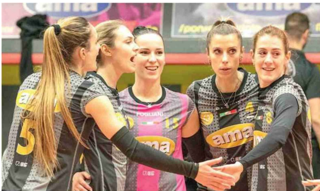
Le ragazze dell'Ama San Martino sono attese alla volata finale della stagione che le vede in corsa per conquistare la promozione nel campionato di Serie B dopo un'eccellente stagione in Serie C

damentale non lasciarci fregare dall'emozione e dalla tensione di essere lì, ai playoff, per la prima volta: abbiamo chiuso il campionato imbattute alla Bombo e sarebbe davvero importante non perdere questo primato proprio ora. Avendo coltivato bene il nostro orticello per tutti questi mesi la squadra è tranquilla, sappiamo che se non andrà come sogniamo il cammino non finirà qui».