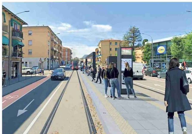
▲ Il progetto Linea verde, come sarà una delle fermate di Corticella

Corticella, in corrispondenza dello svincolo 6. Per la linea Verde si entra nella fase di progettazione esecutiva, col via ai cantieri in estate. Nel frattempo il Comune si prepara a partire coi lavori della linea Rossa in via Riva Reno, dopo il sì della soprintendenza, con alcune prescrizioni che - chiarisce Orioli - «sono tipiche di questa fase dei lavori. Ci sono indicazioni di condotta sugli scavi archeologici e sui materiali da usare nelle finiture dello spazio pubblico». È collegata al cantiere di Riva Reno la preferenziale che è stata tracciata nei giorni scorsi lungo la carreggiata ovest di viale Silvani, e che restringe a due le corsie per i veicoli: con la chiusura dell'incrocio con via Lame le linee di autobus saranno deviate in via Brugnoli e via Calori da dove si immetteranno sui viali per proseguire verso via Saffi o le altre direzioni.