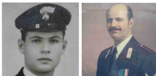
Andrea Lombardini da giovane carabiniere e in un ritratto in età più matura

La "giornata della legalità" è una ricorrenza che si celebra ogni 23 maggio per commemorare le vittime di tutte le mafie. Borghi si appresta ad organizzarla per il secondo anno sul proprio territorio, ma nella data di nascita del suo eroe, il 23 aprile, un mese prima dell'appuntamento nazionale. L'iniziativa voluta dal Comune assumerà quest'anno un particolare rilievo, visto il 50° della morte di Lombardini. Partner del progetto sono l'Asp del Rubicone, le Giacche Verdi, il comando provinciale dei carabinieri, la comunità San Maurizio, l'istituto comprensivo di Sogliano e la polizia locale dell'Unione Rubicone e Mare. Dalle 8.30 alle 10.30 ci sarà un workshop con le forze dell'ordine e gli studenti. Seguiranno, dalle 10.30 alle 12.30, interventi delle autorità sul tema della giornata e la commemorazione del brigadiere borghigiano ammazzato.