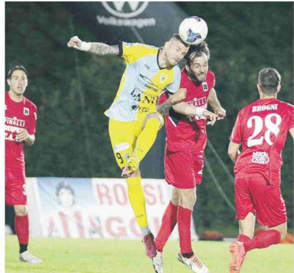
Il Fiorenzuola ha ceduto 3 punti nello scontro di ieri sera contro l'Arzignano allo stadio Del Molin