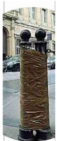
Pericolosi I piloncini davanti al negozio cadono spesso, diventando possibili strumenti per rompere vetrine