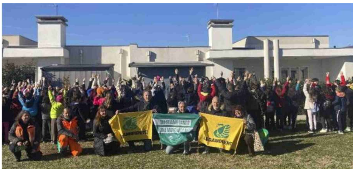
Un momento della Festa dell'Albero celebrata annualmente con le bambine e i bambini delle scuole primarie del territorio e la collaborazione di Legambiente