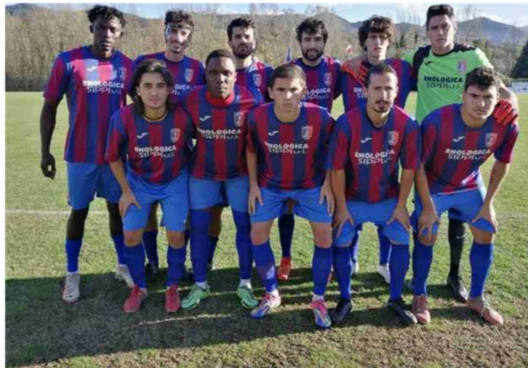
Per il Diegaro stasera c'è la fondamentale sfida salvezza col Novafeltria

Nel girone D, invece, dopo l'anticipo Del Duca-Fratta Terme 0-7, si giocano, sempre alle 20.30, Bakia-Cervia, Bellariva Virtus-Torconca, Cotignola-Civitella, Forlimpopoli-Due Emme, il big-match per il secondo posto Cattolica-Faenza, Misano-Classe, Stella-Sampierana e Verucchio-San Pietro in Vincoli.