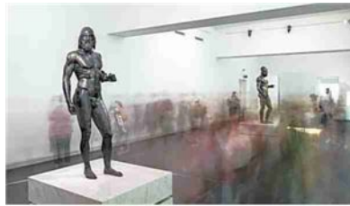
I Bronzi di Riace

ai due fratelli bronzei Eteocle e Polinice, attraverso le voci di una ragazzina che è stata vittima di razzismo ma vuole restare in Calabria, di una giovane madre rifugiata ucraina con la sua bambina, di un ragazzo Rom di Lamezia Terme che vede per la prima volta i due giganti fino alla spiaggia di Cutro. Non a caso, Stefano Mariottini, il sub che ha ritrovato i bronzi li definisce gli “affogati” che lui ha salvato. — e.g.