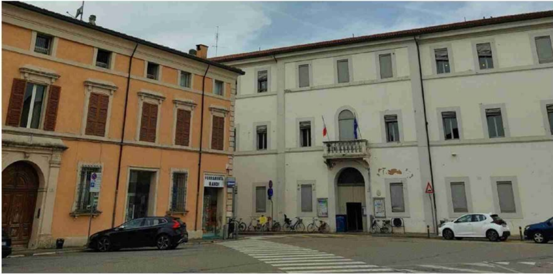
L'area tra piazza Trisi e piazza Cavour a Lugo. Sotto, piazza I Maggio