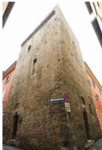
L'interno della casa-torre