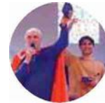
I Ragazzi del Guercino Sono loro i campioni dell'edizione 2024 del Cento Carnevale d'Europa