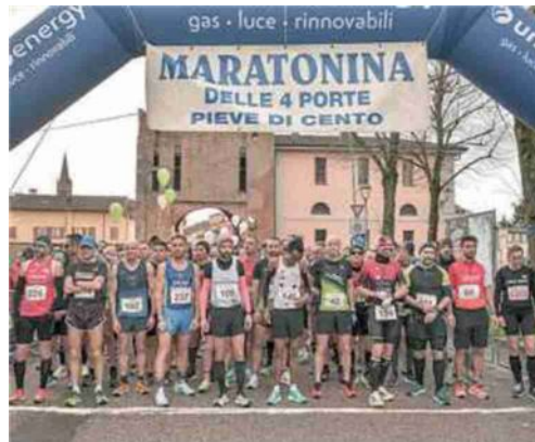
La partenza della Maratonina a Pieve di Cento