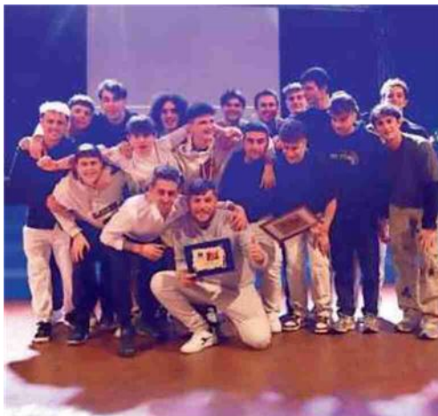
Il gruppo de I Ragazzi del Guercino durante la festa al ristorante I Gabbiani di Pieve di Cento: cena in musica e consegna di targhe personalizzate a molti soci