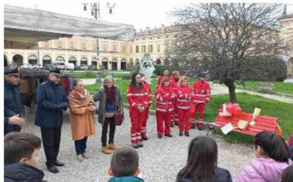
Le immagini della celebrazioni, con i volontari della Croce rossa e gli alunni