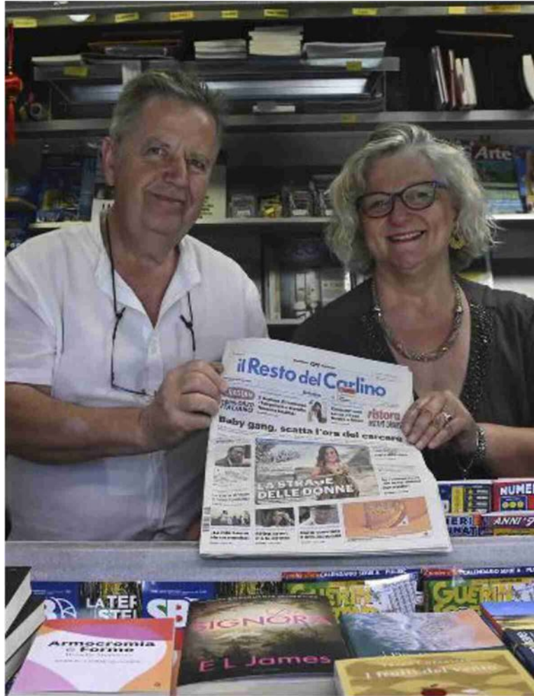
Anche domenica tanti edicolanti al lavoro per garantire ai lettori le notizie