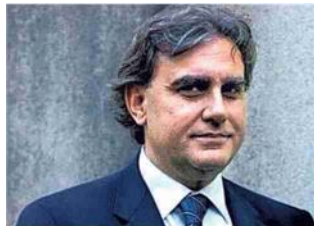
Il pianista Modugno