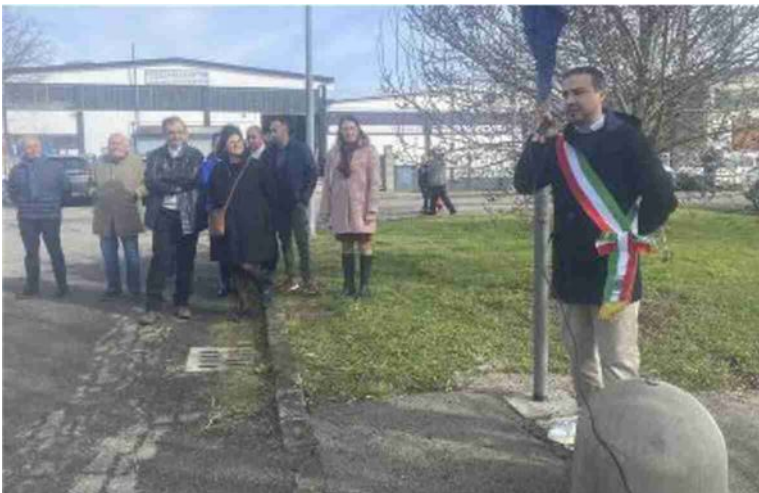
L'intitolazione della pista ciclabile di via Coronella