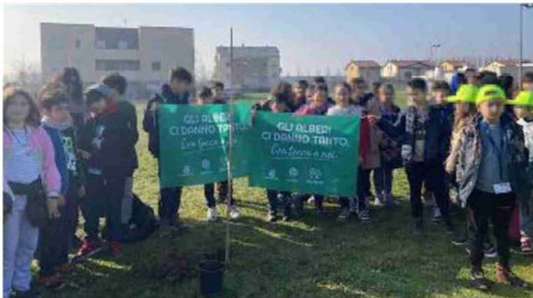
L'iniziativa degli alunni della scuola primaria nell'area verde

A Trebbo di Reno il 27 febbraio sarà messa a dimora una siepe di alloro