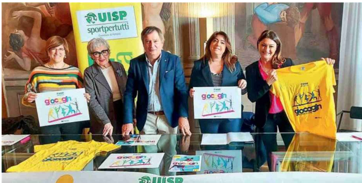
L'incontro di presentazione del Giocagin

Alla Bondi Arena Sabato ritorna qui il classico appuntamento con il Giocagin