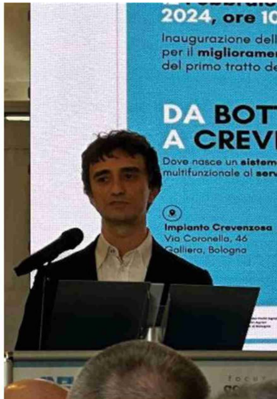
Galeazzo Bignami, viceministro delle Infrastrutture