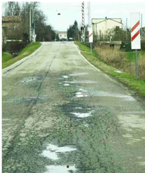
L'asfalto malmesso dello Stradoncello Bentivoglio (Scardovi)

Il persistere delle acque alluvionali ha provocato in molti punti delle spaccature