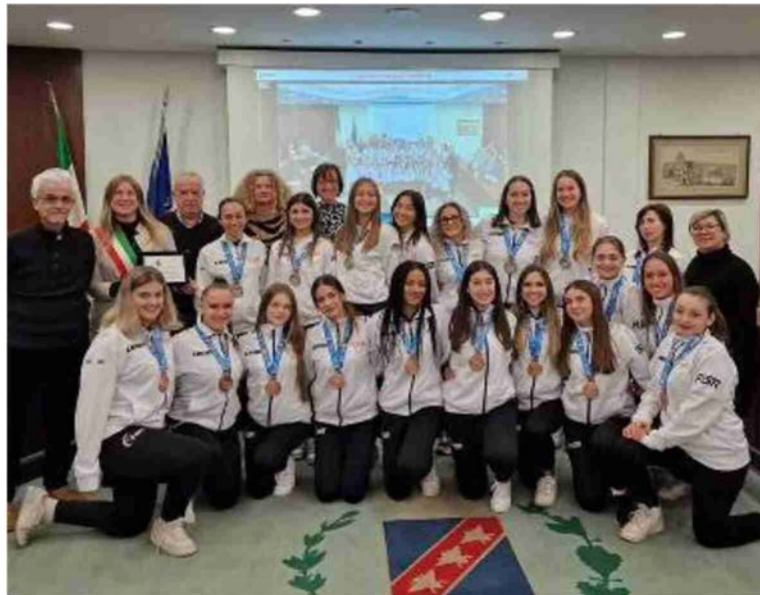
Foto di gruppo in Municipio per la consegna dei riconoscimenti sportivi