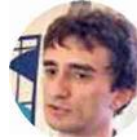
Galeazzo Bignami Il viceministro delle Infrastrutture e dei Trasporti ieri a Galliera

I fondi del Mef via Pnrr Circa 7,5 milioni di euro sulla base della soluzione ideata dal Consorzio Tempistiche rispettate