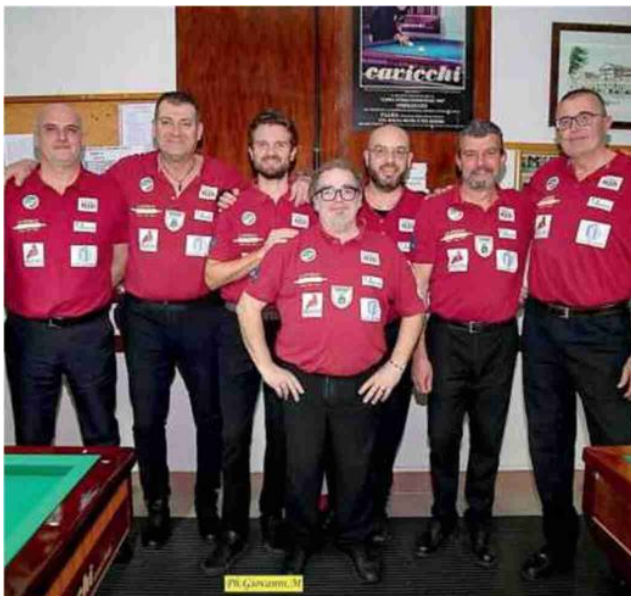
La squadra del Deco-Tec Bentivoglio Gualtieri capace di fermare sul risultato di parità la forte Bagnomoda Millionaire Vezzano

Cade inaspettatamente tra le mura amiche la competitiva Montalto Sport Bar Sport Vezzano per opera di Zero Gravity Tex Master Novellara sale prepotentemente Unipol Sai A. Costa Carpi alla sesta vittoria consecutiva che le permette di agganciare il quarto posto in classifica.