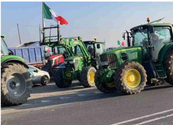
La protesta degli agricoltori a bordo dei loro trattori