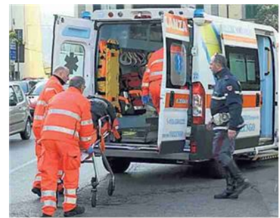
▲ I soccorsi Un'ambulanza del 118