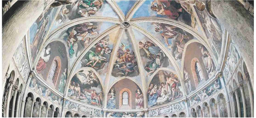
Il "Ritratto di Bentivoglio de' Bentivogli" esposto al PalabancaEventi nella mostra "Una settimana con Ghittoni (e Guercino)" e la cupola della Cattedrale affrescata dall'artista di Cento