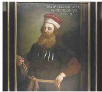
Il quadro esposto in via Mazzini

lecamere di "Report", programma d'inchiesta di Raitre, si sono presentate. Con domande sul prezzo di acquisto e sull'expertise del quadro risultate non proprio gradite ai dirigenti della banca che hanno opposto no comment. Anche Sgarbi è stato chiamato in causa, per un'ipotezzata sua consulenza che il critico d'arte, con "Libertà", ha escluso. E ha stimato in 700-800mila euro il valore del dipinto. ► ROCCELLA a pagina 31