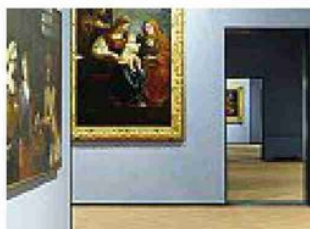
Allestimento/1 Le nuove sale