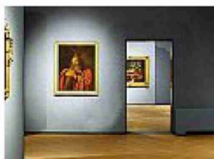
Allestimento/2 Gli spazi rinnovati