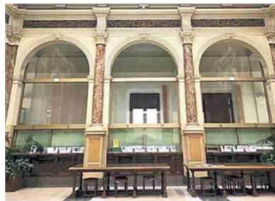
Il palazzo della Banca d'Italia