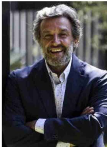
L'attore Flavio Insinna