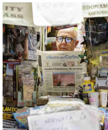
Un presidio importante che funziona anche nei giorni festivi

NEI COMUNI Un'informazione precisa e dettagliata per non perdere nessun evento