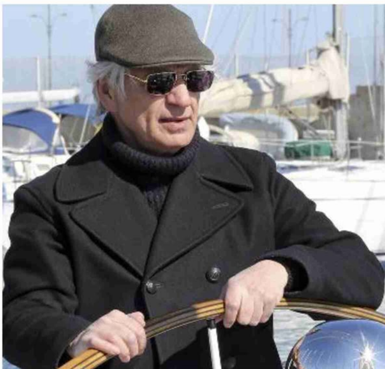
Fabrizio Bentivoglio, qui sopra, nei panni di Raul Gardini