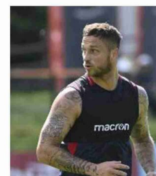
Marko Arnautovic, 34 anni