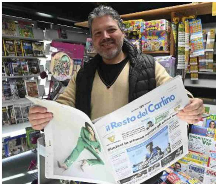
Sono a decine le attività che coprono il territorio con la vendita del giornale