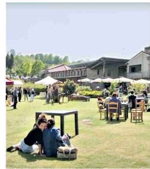
Da domani il mercato della Fattoria Zivieri che ha scelto come base le colline attorno a Sasso Marconi

lustrazione e corsi di pittura con colori naturali. Una fattoria didattica che però concede molto anche ai sapori, forte dei suoi ottanta ettari di boschi e prati che accolgono più di 350 capi di bestiame, dalle pecore biellesi alle capre della Val Nerina, dai bovini romagnoli ai maiali neri di Parma, oltre che un orto di più di due ettari. Cibo per tutti i gusti in stand all'aperto e musica jazz. Ingresso gratuito, laboratori da prenotare: prenotazioni@fattoriazivieri.it .