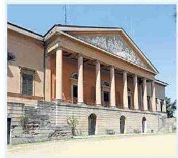
Le Baccanti a Villa Aldini

tragedia "Baccanti" di Euripide, uno dei testi fondamentali del teatro antico. Villa Aldini, via dell'Osservanza 37, ore 19, ingresso 20 euro, prenotazione obbligatoria www.archiviozeta.eu