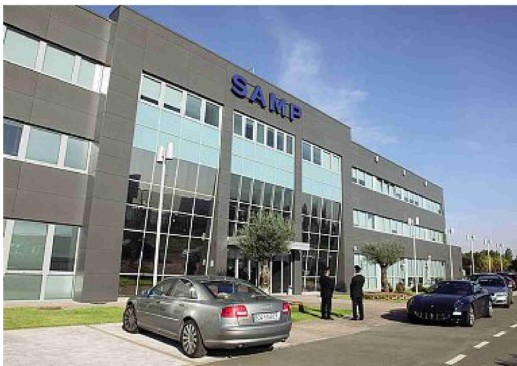
Sede Nata nel 1936 la Samp ha mantenuto il suo quartier generale a Bentivoglio su un'area di quasi 9 mila mq