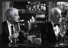
IL RITORNO DI CASANOVA