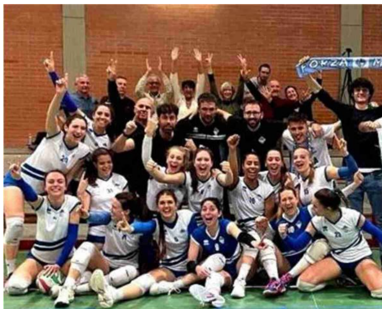
Le giocatrici del Massavolley in festa dopo la matematica vittoria del girone

Domenica arriva Argelato per allenarsi in vista dei playoff promozione