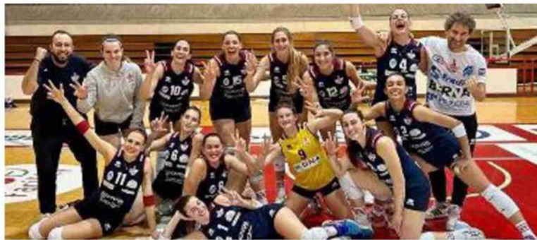
Le ragazze della Fcr Edil Vtb dopo una vittoria: militano in serie B1 femminile