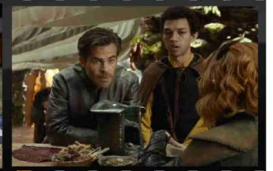
DUNGEONS & DRAGONS L'ONORE DEI LADRI