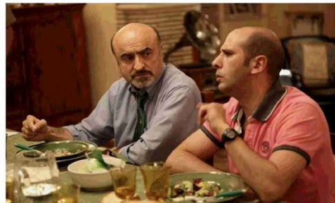
Sopra Marescotti nel suo ultimo spettacolo teatrale dedicato al ciclista Calzolari, sotto in una scena del film di Muccino "A casa tutti bene" e con Checco Zalone in uno dei suoi film