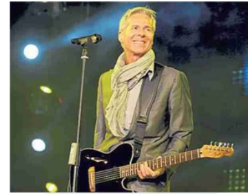
▲ EuropAuditorium Baglioni

L'attore, comico e autore Natalino Balasso sale sul palco del Duse con un grande libro contenente oltre 250 lemmi e improvvisa una serie di monologhi. Teatro Duse, via Cartoleria 42, ore 21, ingresso 18-29 euro