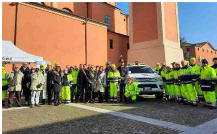
Foto di gruppo per i volontari della protezione civile Riolo in occasione dell'inaugurazione del nuovo pick-up per le attività istituzionali