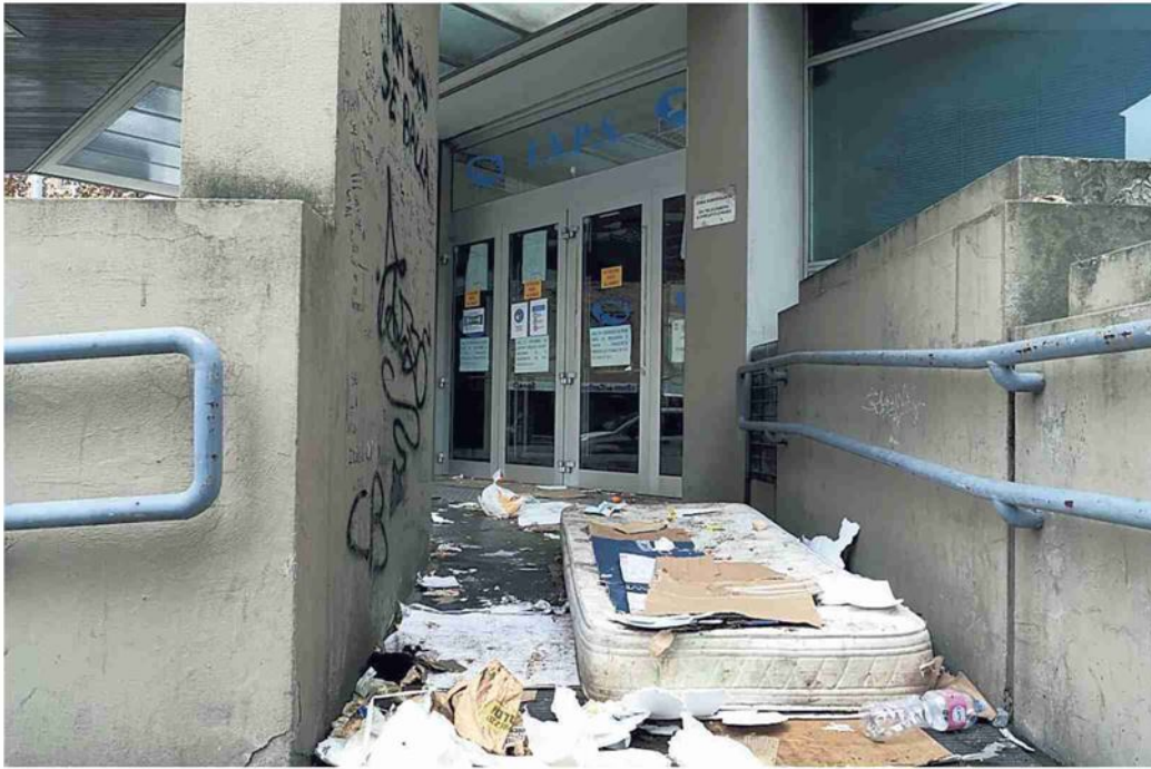
▲ Il giaciglio Un materasso abbandonato da mesi davanti all'ex sede Inps in via Milazzo