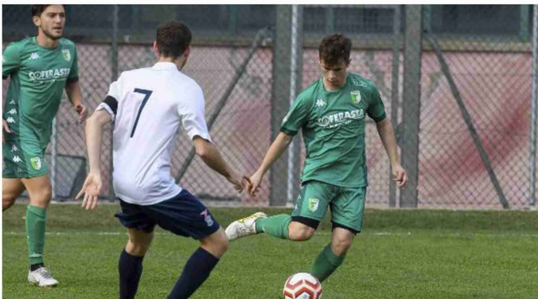
Correggiari ancora assente per il Sant'Agostino, oggi impegnato a Bentivoglio

Masi Torello sul campo del fanalino Valsanterno dopo il pari di carattere contro il Medicina