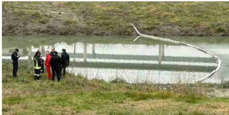
Una delle barriere assorbenti che sono state sistemate lungo il fiume Reno