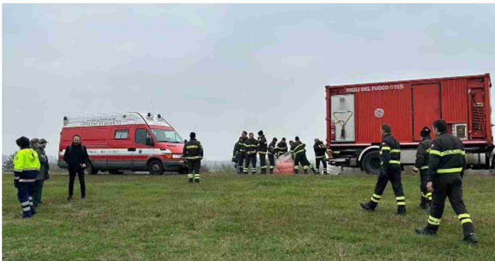
Per contenere l'inquinamento si sono mobilitati i vigili del fuoco, la protezione civile e le forze dell'ordine

Due volontari avrebbero indicato il punto da cui parte la chiazza oleosa