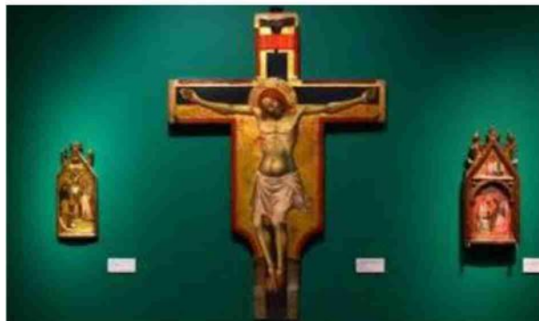
Sopra, opere di Concetto Pozzati a Palazzo Fava e Milva A lato, la mostra su Lippo di Dalmasio