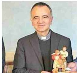
Statuina al vescovo Rappresenta il passaggio generazionale