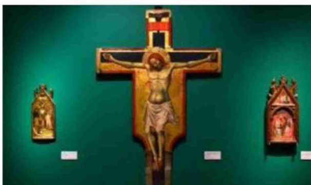
Sopra, opere di Concetto Pozzati a Palazzo Fava e Milva A lato, la mostra su Lippo di Dalmasio