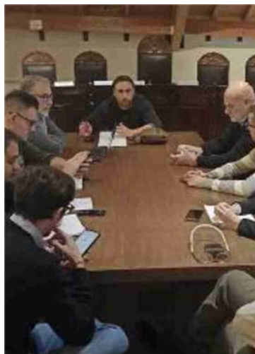
Un momento della Commissione