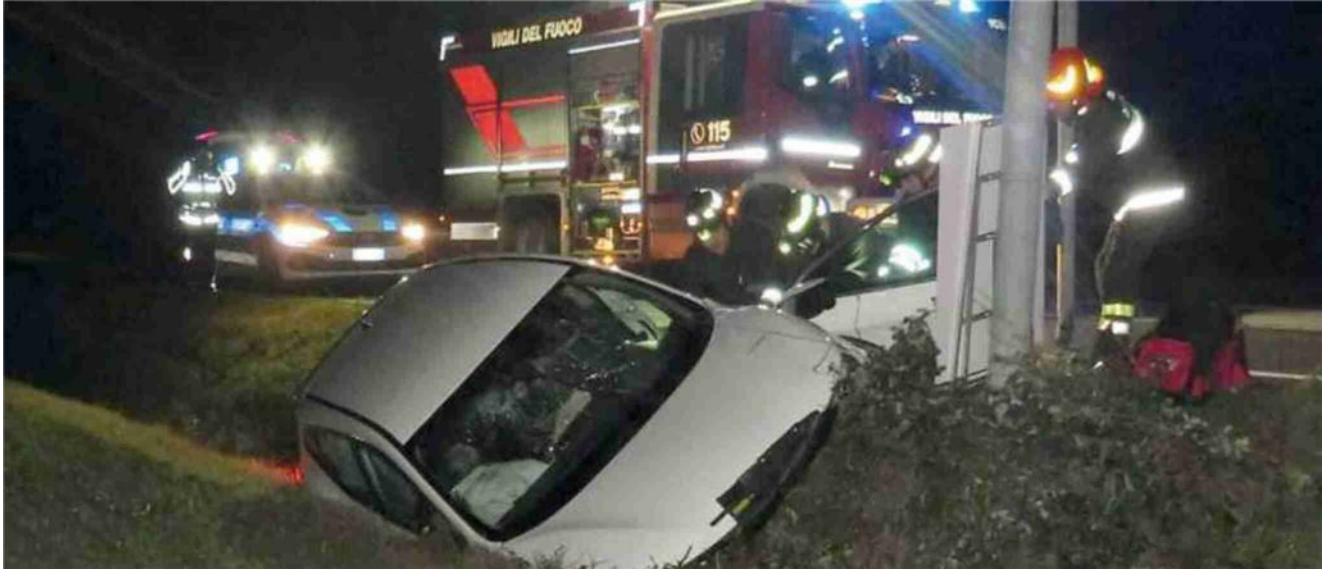
La vettura di Valter Venieri e l'intervento di vigili del fuoco e Polizia locale