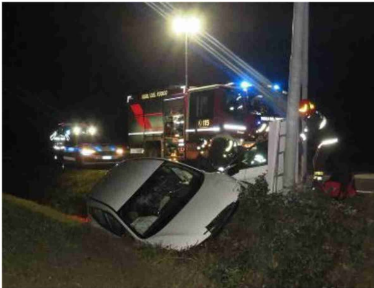
L'auto di Valter Venieri finita nel fosso dopo lo schianto contro il palo