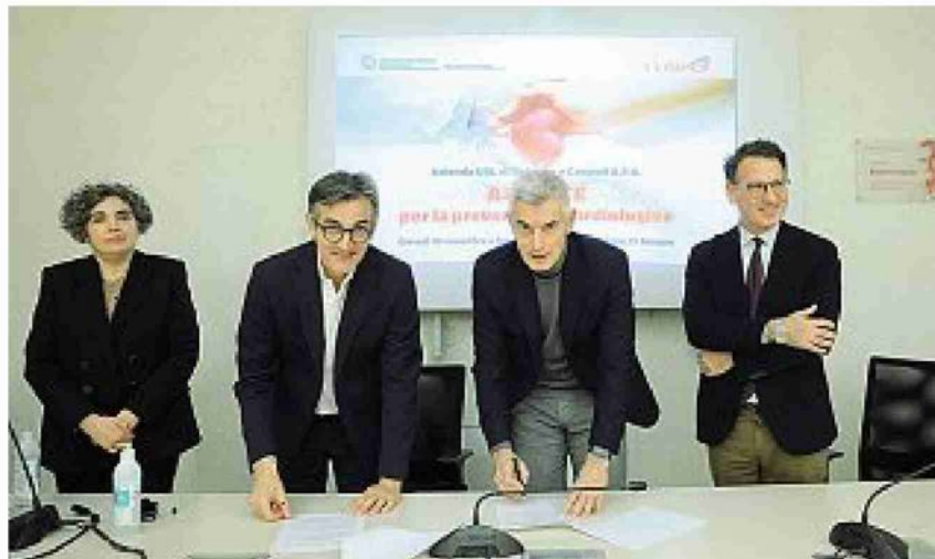
L'intesa Il momento della firma dell'accordo tra l'Ausl di Bologna e l'azienda Coswell

Tortorici Occasione importante anche per i medici di uscire dall'ospedale e per entrare in contatto con le comunità e promuovere stili di vita sani