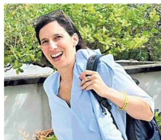
Dem Elly Schlein

La segretaria Pd alla tre giorni di Coalizione Civica: “Insieme per il diritto all'abitare”