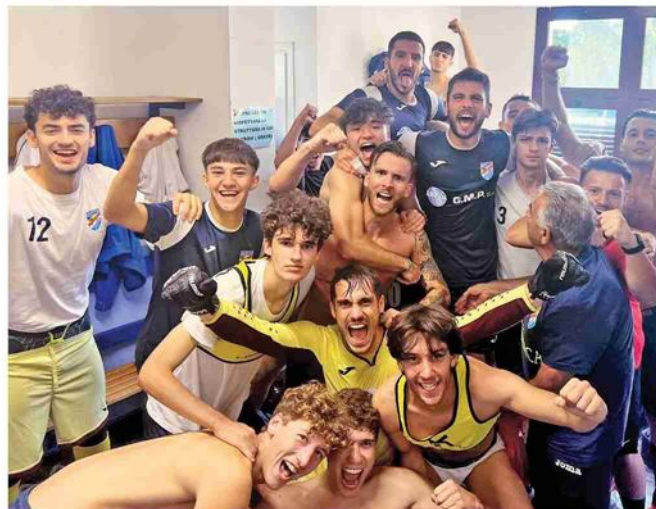
Il Granamica festeggia dopo il successo sul Castenaso